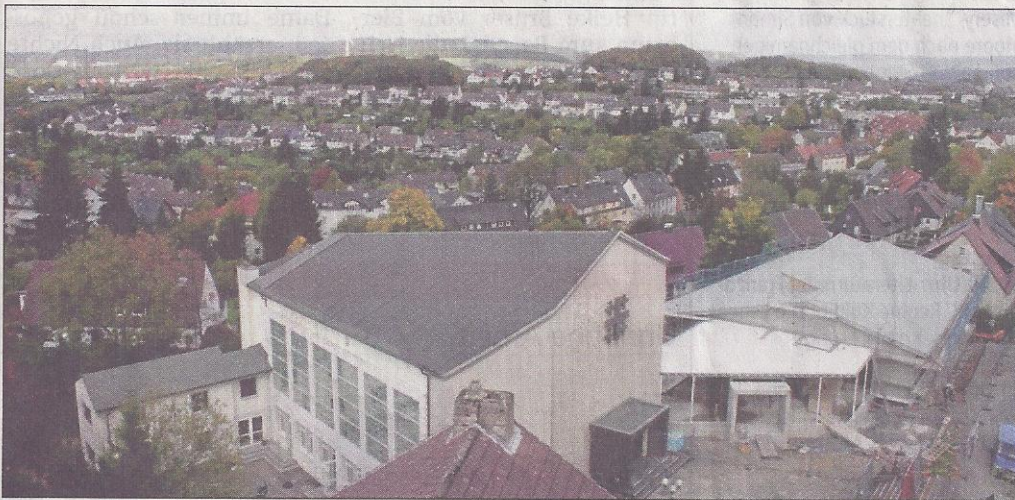
Blick vom Turm: Im Vordergrund links der Kirchenneubau des Jahres 1965, an den sich nun der weit gediehene funktionale Neubau des Gemeindezentrums anschließt.

Handlungsbedarf. Als entsprechende Beschlüsse gefallen waren, kam es 1949 zur Gründung des Kirchbauvereins und ab Oktober 1951 wurden fleißig „Kirchbaustei-